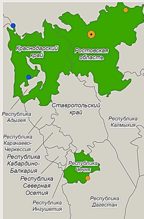
Краснодарский край Республика Чечня